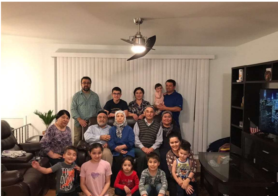
Шариповлар ва Насафийлар Чикаго шаҳридаги хонадонда.