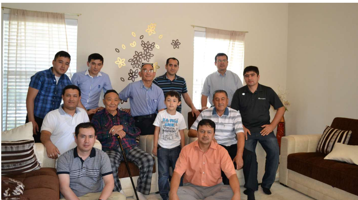
Олим Шарипов бошчилигидаги Чикаго ўзбек-америка ассоцияцияси аъзолари Ўзбекистон Халқ шоири Абдулла Орипов билан учрашувда. Хьюстон, Техас.