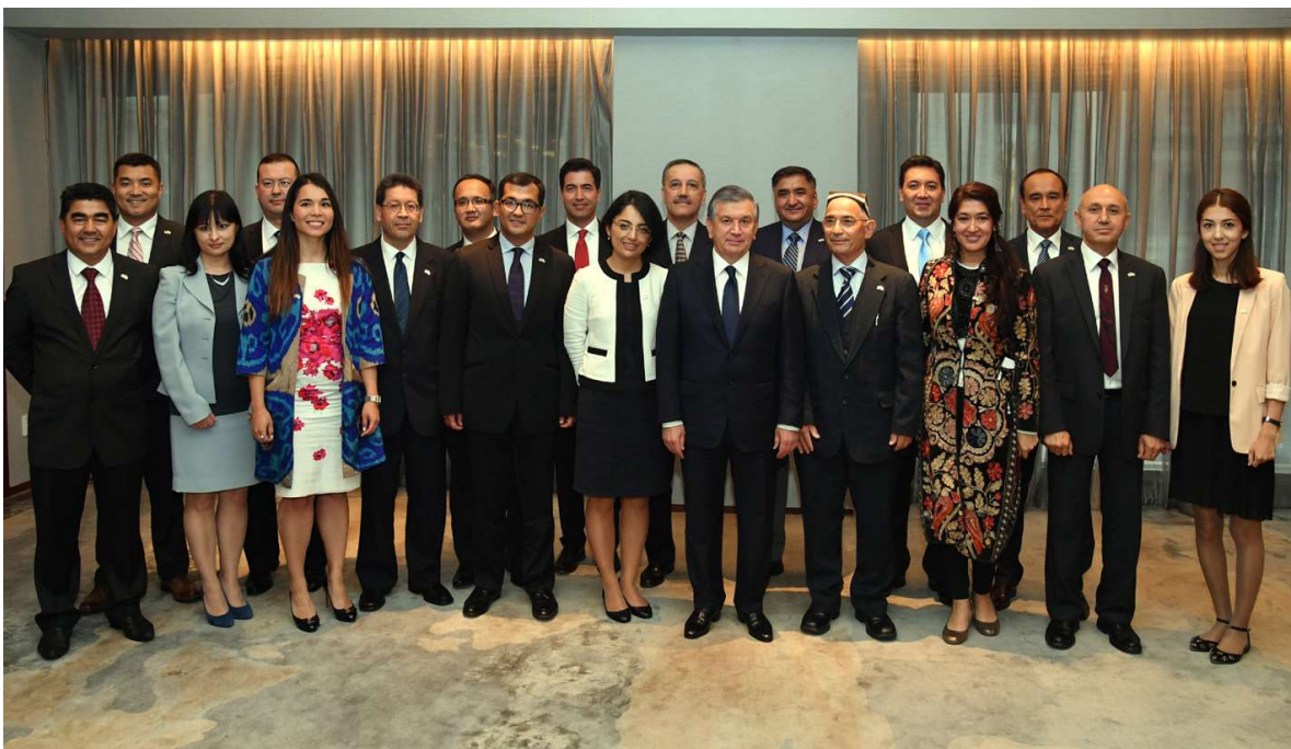
Ўзбекистон Президенти Шавкат Мирзиёев АҚШдаги бир гуруҳ ўзбекистонлик олимлар, диаспора раҳбарлари билан учрашувда.