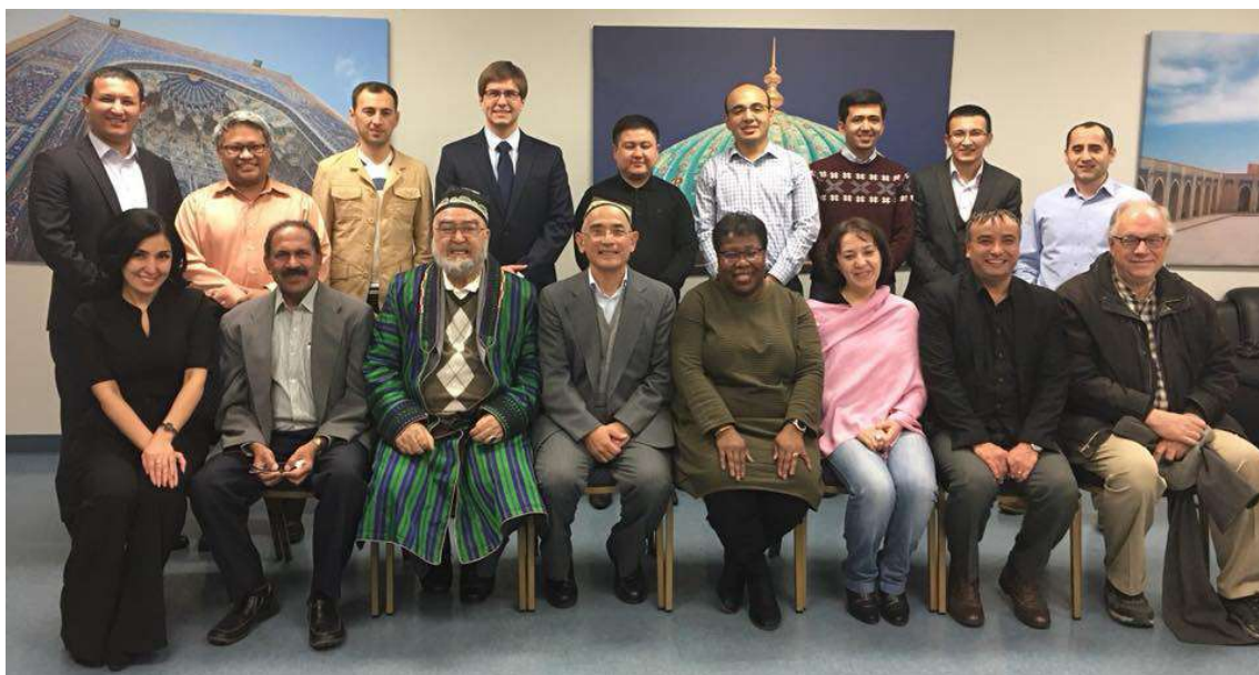
УААС аъзолари Ўзбекистонлик делегация вакиллари билан.