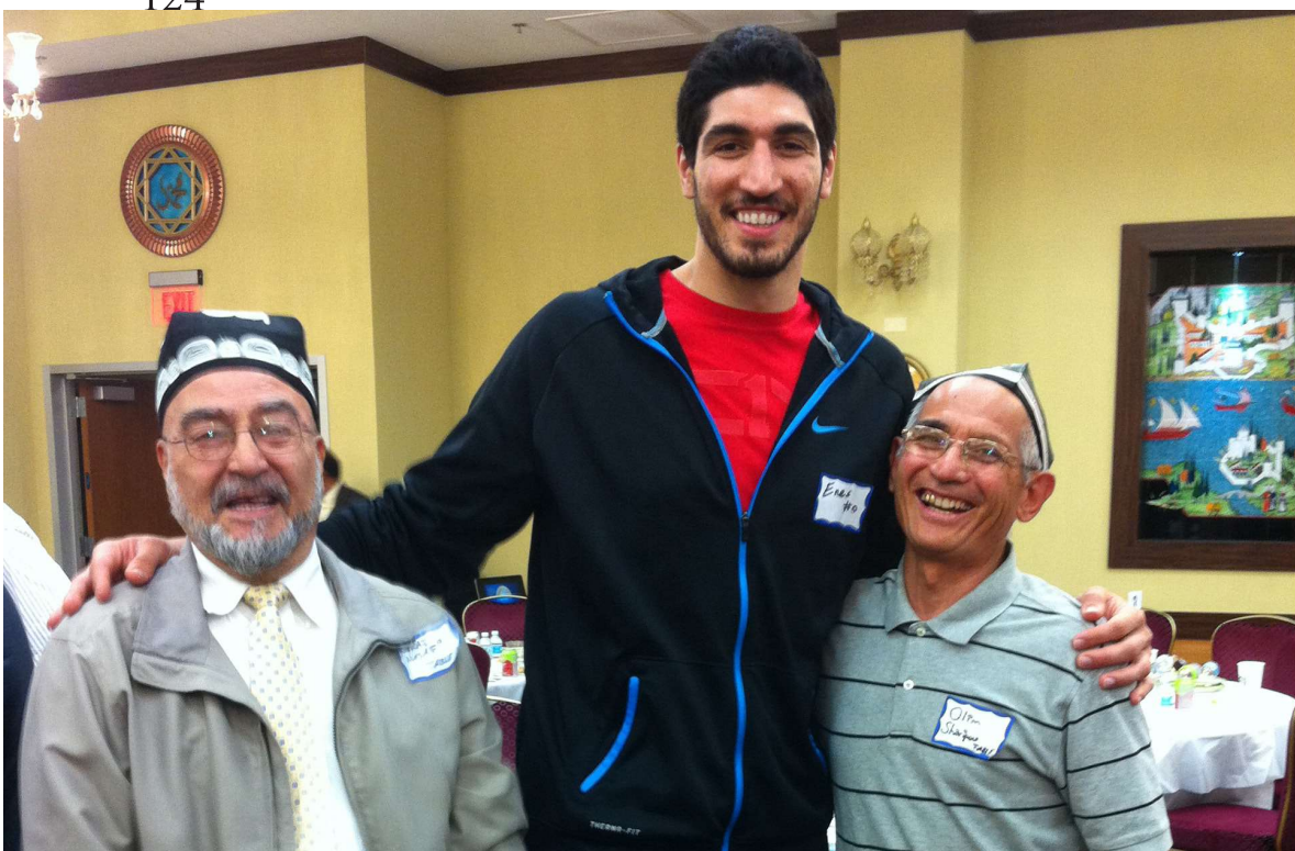
Сирожидди хожи Насафий ва Олим Шарипов НБА Юта-Жаз клубининг турк баскетболчиси Энес Кантер билан суратга тушмоқда.