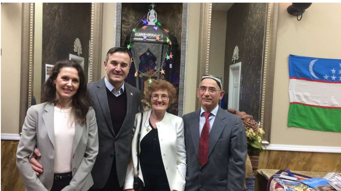
Олим Шарипов Туркиянинг Чикаго шаҳридаги Бош консули Умут Ажар билан.